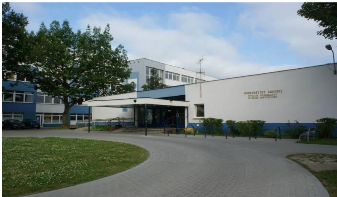
Wejście do budynku Wydziału Historycznego UG